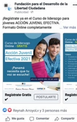
Instagram feed Carousel