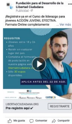
Instagram explore video